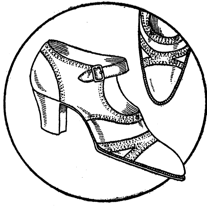
Modelo 50.753 Zapato fister, color oscuro, tacón suela de 4 y 5 cm. a Ptas. 18 par

VENTA DIRECTA DEL PRODUCTOR AL CONSUMIDOR