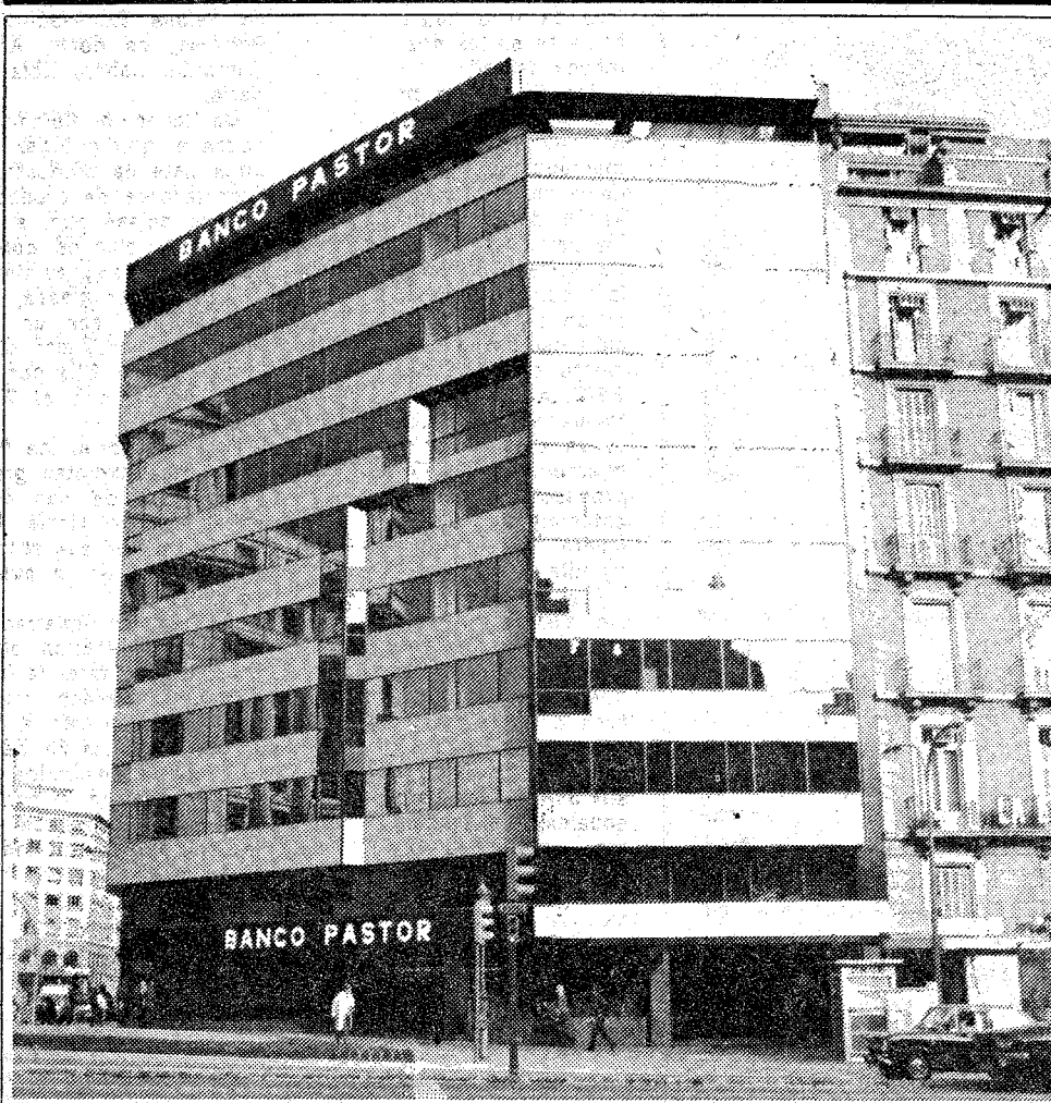
El Edificio Pastor visto desde el cruce de la calle Aragón con el Paseo de Gracia.

EXPORTACION (CESCE), FIRST NATIONAL BANK OF CHICAGO, DESARROLLOS TURISTICOS, S.A. (AJHORY), ARAB INVESTMENT PROMOTION CO. (ARIPCO), GRUPO DE EMPRESAS GOA.